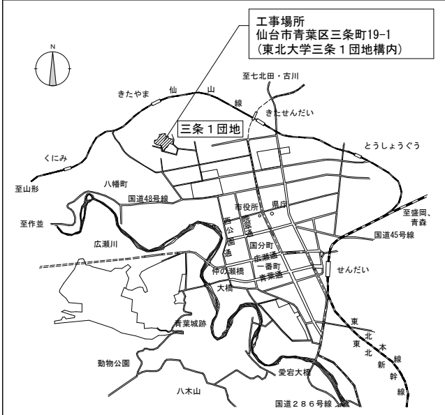
案内図 (No Scale)