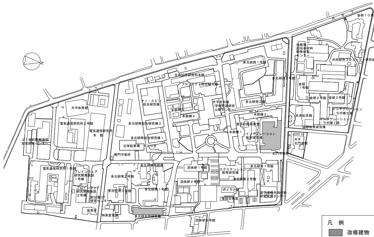
片平団地 配置図 S=1/5000 (A4)